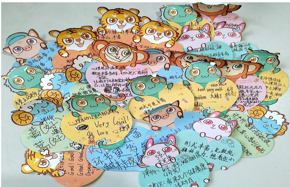
学生对心理健康月系列活动的评价

本次心理健康月活动由四月开始预热，五月进入活动高潮。知识讲座、漫画竞赛、主题班会、家庭教育、视频观看、心育家园建设等系列活动动静结合、形式多样、精彩纷呈。通过师生参与活动及媒体大力宣传，基本达到了育人育心，率先垂范的效果。同学们在活动中积极思考、融入情感，关注心理健康、挖掘自身潜力，在校园中形成了良好的心理健康教育氛围以及助人自助的影响效力。