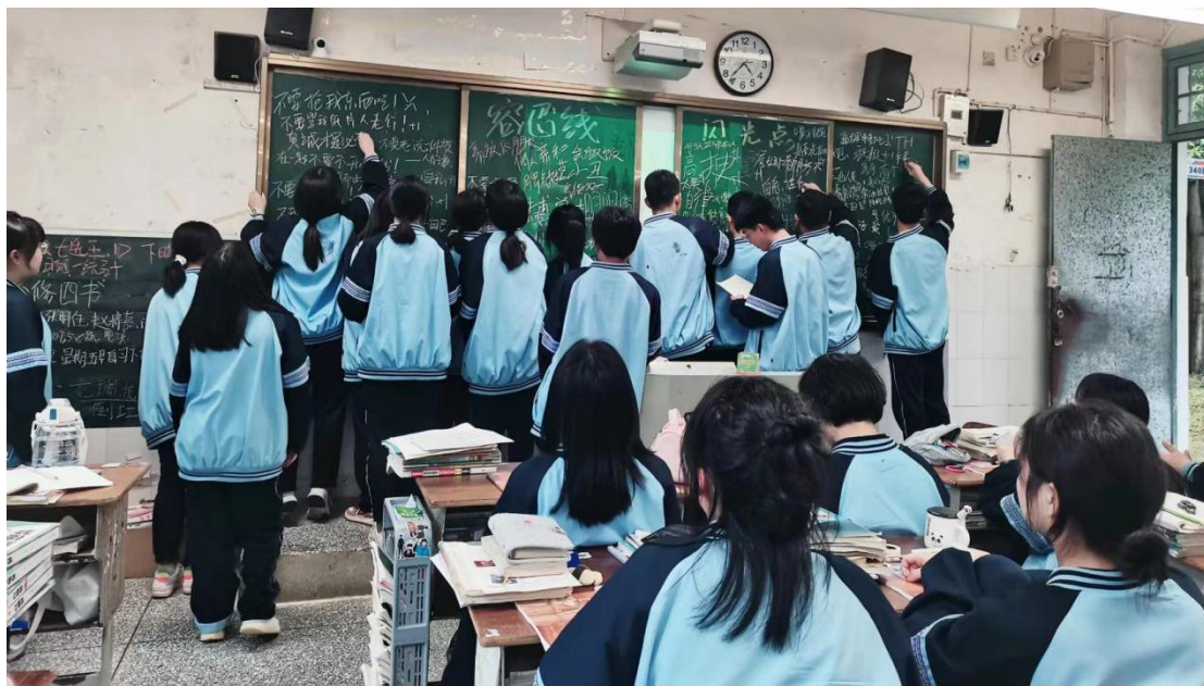
组织各班开展“敞开心扉”主题班会

自己的心声、发现他人的闪光点，亦让同学们明白朝夕相处的陪伴能够在我们心中生根、发芽，开出诱人的花朵。