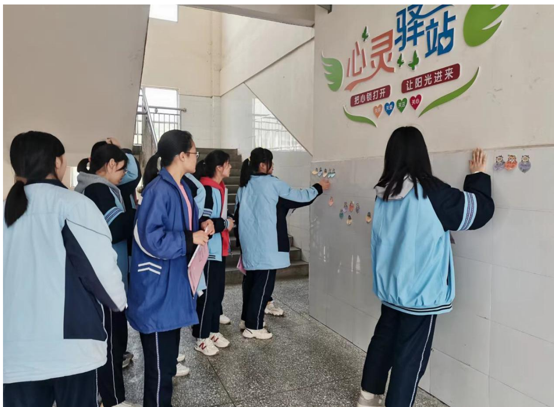
学生参与“我心之声”留言墙板块活动

心理健康教育中心是学校实施心理健康教育的主要阵地，是师生释放心灵、敞开心扉的主要场所，心育中心的建设对师生具有重要的陶情、育美、育心灵的作用，对于师生的心理健康、个性发展具有积极的心理暗示作用。鼓励师生参与心育中心的建设活动，能够让师生的更好地融入心育环境，展现主人翁意识，完善属于自己的心育家园。“我心之声”留言墙板块，让学生能够尽情地述说自己的心声。“花园阳台”板块，开展认领花草植物活动，进行生命教育，营造心育氛围。“我心中的沙具”板块，鼓励学生把“我心中的沙具”摆放于沙架中，让沙盘游戏“活”起来。“心灵成长的阶梯”心理读物板块，举行“传递温暖，‘书’送希望”赠书活动，让心灵成长之书帮助更多的人。