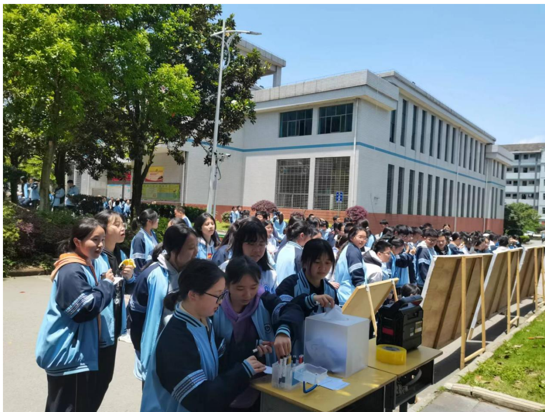
心理四格漫画展出及大众评选

为调整学生心理，倡导凝聚陪伴的力量，在心理健康月之际，我校举行了“陪伴”主题四格漫画竞赛活动。活动以“陪伴”为主题向全校学生征集心理四格漫画作品，以期同学们用丰富多彩的漫画形式表现自己在成长过程中所体验到的陪伴的力量。同学们通过手中的笔，让“陪伴”在心中不再是一个抽象的概念，而是与生活、学习息息相关的所有能够观察、感受、体验和想象到的一切。绘画作品也不再只是一幅简单的画作，它更是情绪的出口、情感的寄托。自活动开展以来，同学们踊跃参与，共收到学生作品近百余幅。经组织学生大众评选及教师专业评选，共评选出一等奖2名，二等奖6名，三等奖10名。